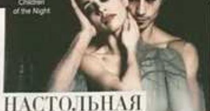
Ballet Variations of Life, Ukrainian Dance Theatre