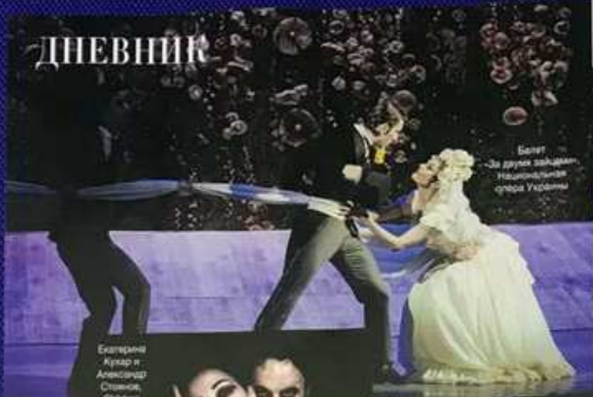
Балет «За друзей забываем» Национальной оперы Украины